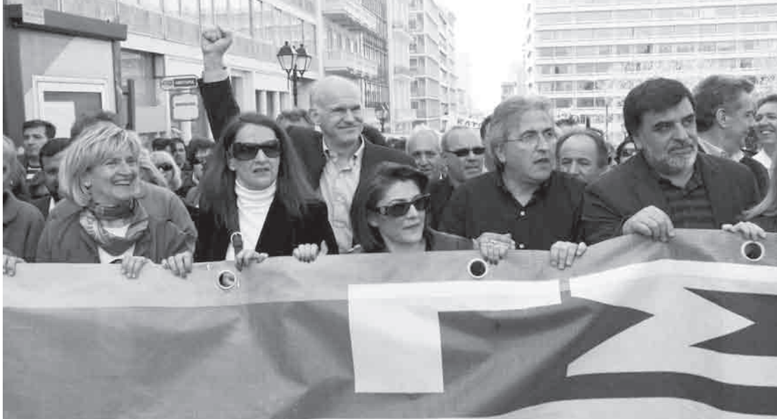
Διαδήλωση ενάντια στο ασφαλιστικό, 2008... Επειδή στην Ελλάδα όλα μπορούν να συμβούν, ας προσέχουμε: ο χθεσινός οργισμένος διαδηλωτής μπορεί να είναι ο αυριανός πρωθυπουργός.

των περιφερειακών και δημοτικών εκλογών (Νοέμβριος 2010) όπου τα ποσοστά αποχής αυξήθηκαν ανάμεσα στους δυο εκλογικούς γύρους (από 40% στο 54% και από 39% στο 51%, αντίστοιχα).